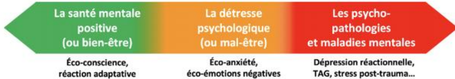
Figure 1 : Continuum des 3 états en santé mentale